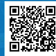
Arqueo de Caja